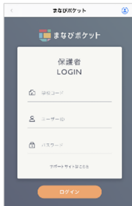
スマートフォンの場合